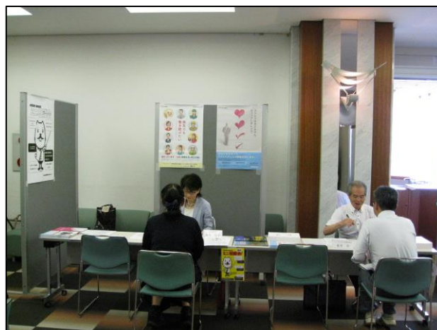
産業保健相談コーナーの様子