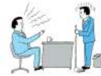
過小な要求 業務上の合理性なく、能力や経験とかけ離れた程度の低い仕事を命じることや仕事を与えないこと