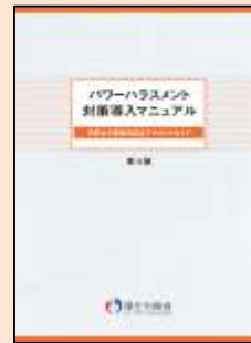
パワハラ相談対応者の具体的な対応例

職場の実態を把握するためのアンケート調査やパワーハラスメントに関して理解を深めるための社内研修は、職場のパワーハラスメント防止対策として効果的です。