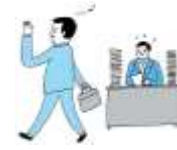
過大な要求 業務上明らかに不要なことや遂行不可能なことの強制、仕事の妨害