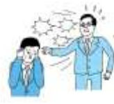
精神的な攻撃 脅迫・名誉棄損・侮辱・ひどい暴言