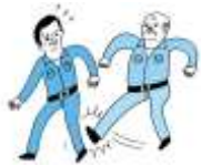
身体的な攻撃 暴行・傷害