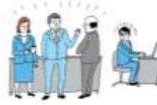
人間関係からの切り離し 隔離・仲間外し・無視