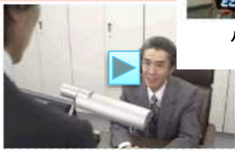
仕事の上で叱る時、どのように叱ればいいでしょう？(セーフレベル)