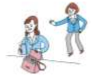
個の侵害 私的なことに過度に立ち入ること