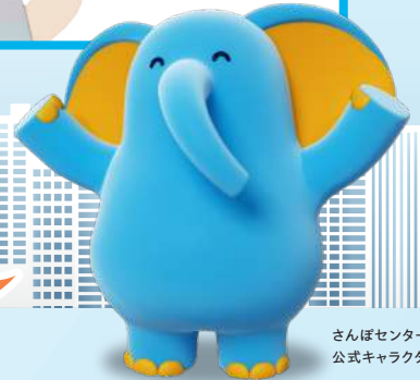
さんぽセンター 公式キャラクター