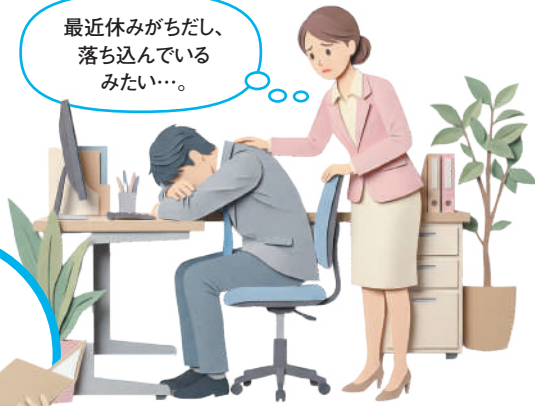
産業カウンセラー