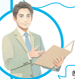
社会保険労務士等