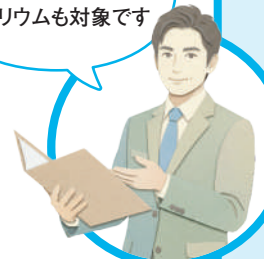
労働衛生コンサルタント